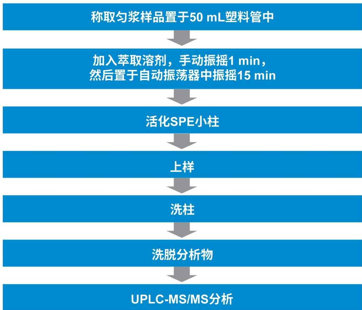
图1.利用SPE在捕集和洗脱模式下进行样品前处理以测定鸡肉中禁用兽药的工作流程

向鸡肉提取物中添加CAP和NF以制备样品时，使用两种不同的SPE吸附剂填料：对CAP使用Oasis HLB（部件号：WAT094226 < https://www.waters.com/nextgen/us/en/shop/sample-preparation--filtration/wat094226-oasis-hlb-3-cc-vac-cartridge-60-mg-sorbent-per-cartridge-30--m-1.html >）；对NF使用Oasis MCX（部件号：186000254 < https://www.waters.com/nextgen/us/en/shop/sample-preparation--filtration/186000254-oasis-mcx-3-cc-vac-cartridge-60-mg-sorbent-per-cartridge-30--m-1.html >）。两种填料均在捕集和洗脱模式下使用，以浓缩分析物，尽量提高共提取分子的去除率。